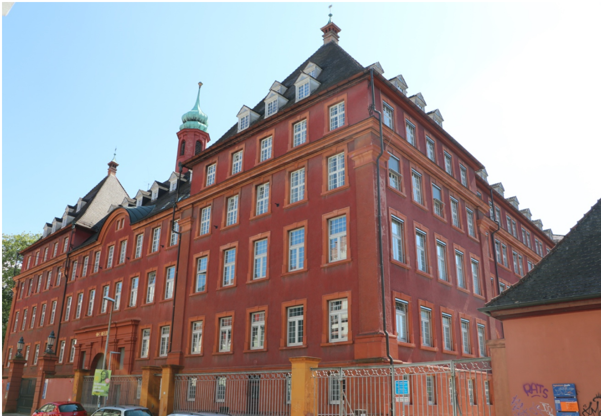
Der Herderbau (Tennenbacher Straße) Das Herz unserer Fakultät